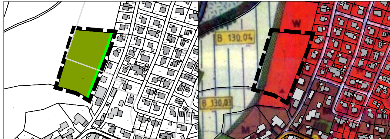
Herausnahme von W-Darstellung, ca. 1,1 ha, Fl. Nr. 63/4 bisherige Darstellungen