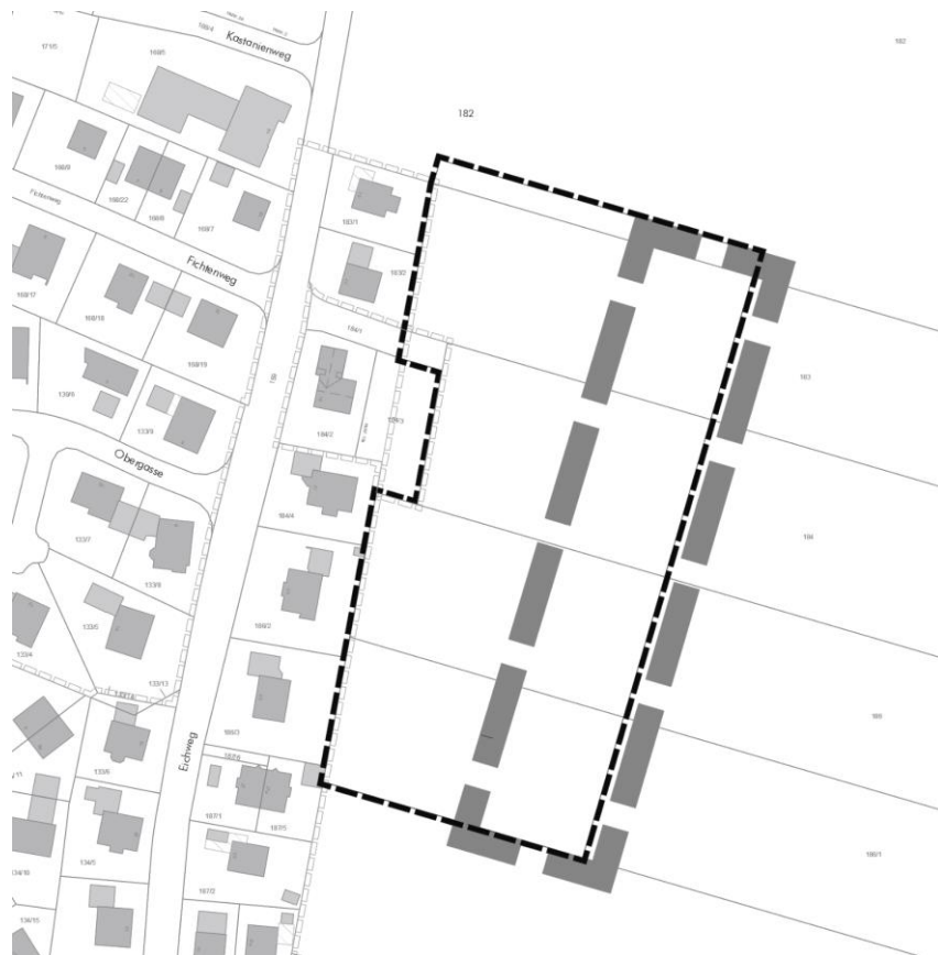
Abbildung 1: Lageplan des Geltungsbereiches der Neuausweisung zum gegenständlichen Bebauungsplan (dünn, Schwarz) und der Änderung des Flächennutzungsplanes (dick, grau), unmaßstäblich