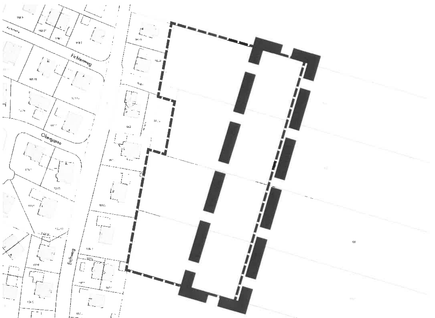
Abbildung 2: Lageplan der Geltungsbereiche im Süden (BBP Nr. 8 „Eichweg / Römerstraße“, 3. Änd. und Erw.) FNP: fett , BBP: dünn